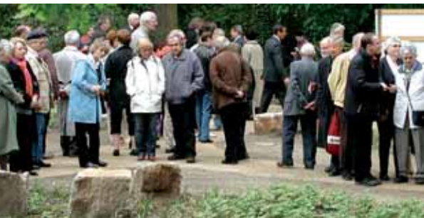
Einweihung zu Pfingsten 2010

Die Kosten der individuellen Beerdigung und die Grabkosten tragen die Interessenten selbst. Die Friedhofsgebühren betragen derzeit für eine Erdbestattung ca. 780 Euro und für eine Urnenbestattung etwa 640 Euro. (Stand: April 2011)