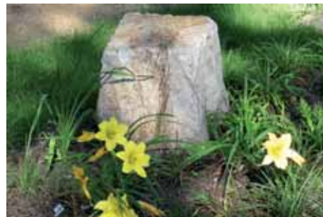
Natursteinquader als Grabkennzeichnung