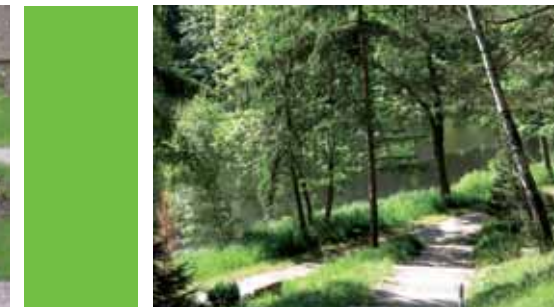
Parkidylle auf dem Waldfriedhof